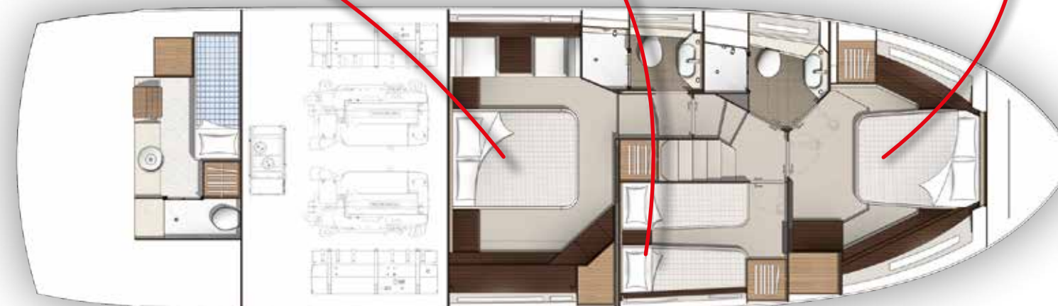
Cabina Vip in prua, ospiti centrale, armatore a poppa, due bagni, cabina marinaio a poppa con bagno. Salone con zona pranzo/salotto, plancia di guida e cucina. Pozzetto attrezzato a poppa, prendisole di prua. Fly-bridge con zona pranzo, salotto e timoneria.