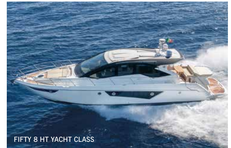
FIFTY 8 HT YACHT CLASS

HARD TOP – La famiglia comprende i cruiser M38 HT, M44 HT, 54 HT, Fifty 6 Yacht Class, Fifty 8 HT Yacht Class e Sixty 4 HT Yacht Class, progettati per la crociera impegnativa.