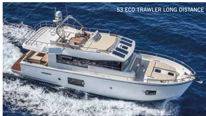
53 ECO TRAWLER LONG DISTANCE

CRUISER - Comprende i due modelli Zaffiro 29 e Zaffiro 32, eleganti daycruiser