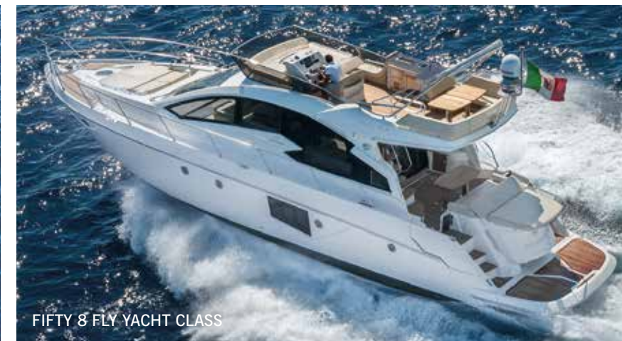
FIFTY 8 FLY YACHT CLASS

FLYBRIDGE – Comprende i modelli 43 Fly, 54 Fly, Fifty 8 Fly Yacht Class e Sixty 6 Fly Yacht Class, motoryacht da crociera che si distinguono per design e abitabilità degli interni.