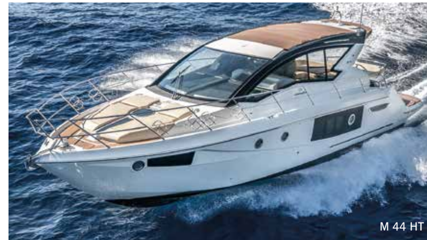
M 44 HT

OUTBOARD – È la gamma di barche equipaggiate con motorizzazioni fuoribordo, che comprende i modelli Panama 24, Panama 29 e Panama 32, daycruiser entry level ma ben equipaggiate.