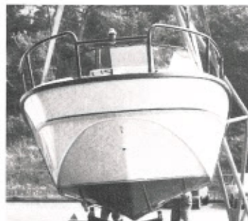
Sopra e sotto, rispettivamente le viste di prua e di poppa dello scafo, che presenta una carena a V con pattini longitudinali e spigoli accentuati.

della velocità si basa su elementi di esperienze personali, ma sicuramente viaggia intorno ai trenta nodi, non molto importante come punta velocistica assoluta, ma considere-