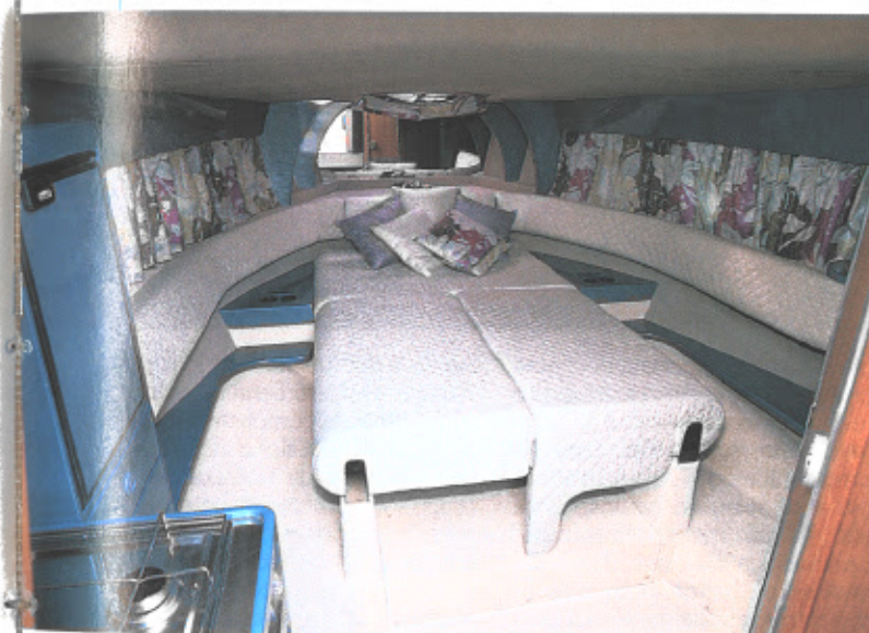
Nella pagina accanto, in basso, il prendisole di poppa e il divano tondo, il comodo posto guida 2 + 1 con la strumentazione e a sinistra il portello che chiude l'accesso allo spazio sotto prua, e il vano che ospita i parabordi. In alto, la zona interna con il matrimoniale che si trasforma in salotto, il bagno con wc e doccia. Qui sopra, la versione notte e, sotto, l'angolo cucina.