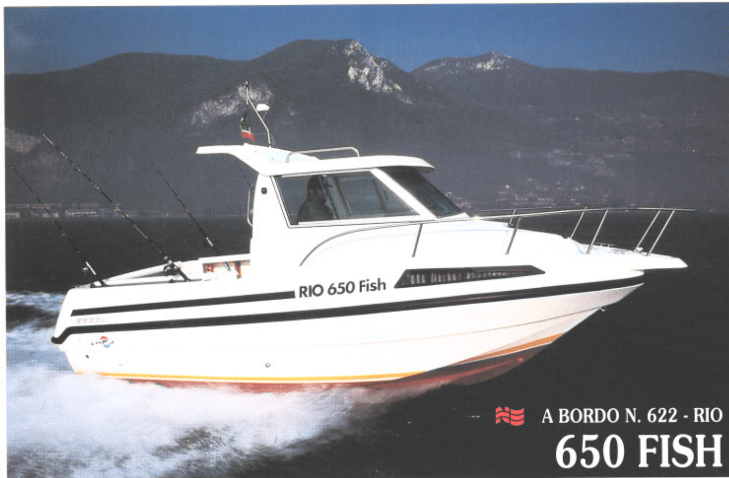
A BORDO N. 622 - RIO 650 FISH

I pescasportivi amano barche sicure, spaziose e soprattutto pensate per ospitare al meglio le varie attrezzature e il tanto desiderato frutto della propria passione: il pesce.