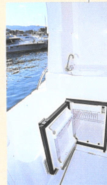
Il pozzetto - in alto a destra - è molto grande. Da esso si accede a una comoda plancia poppiera, foto a sinistra. Qui sopra, il posto di pilotaggio e il mobile cucina. Sotto, il matrimoniale di prua.