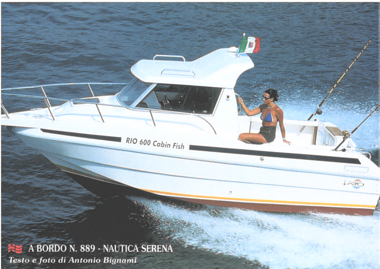
A BORDO N. 889 - NAUTICA SERENA Testo e foto di Antonio Bignami