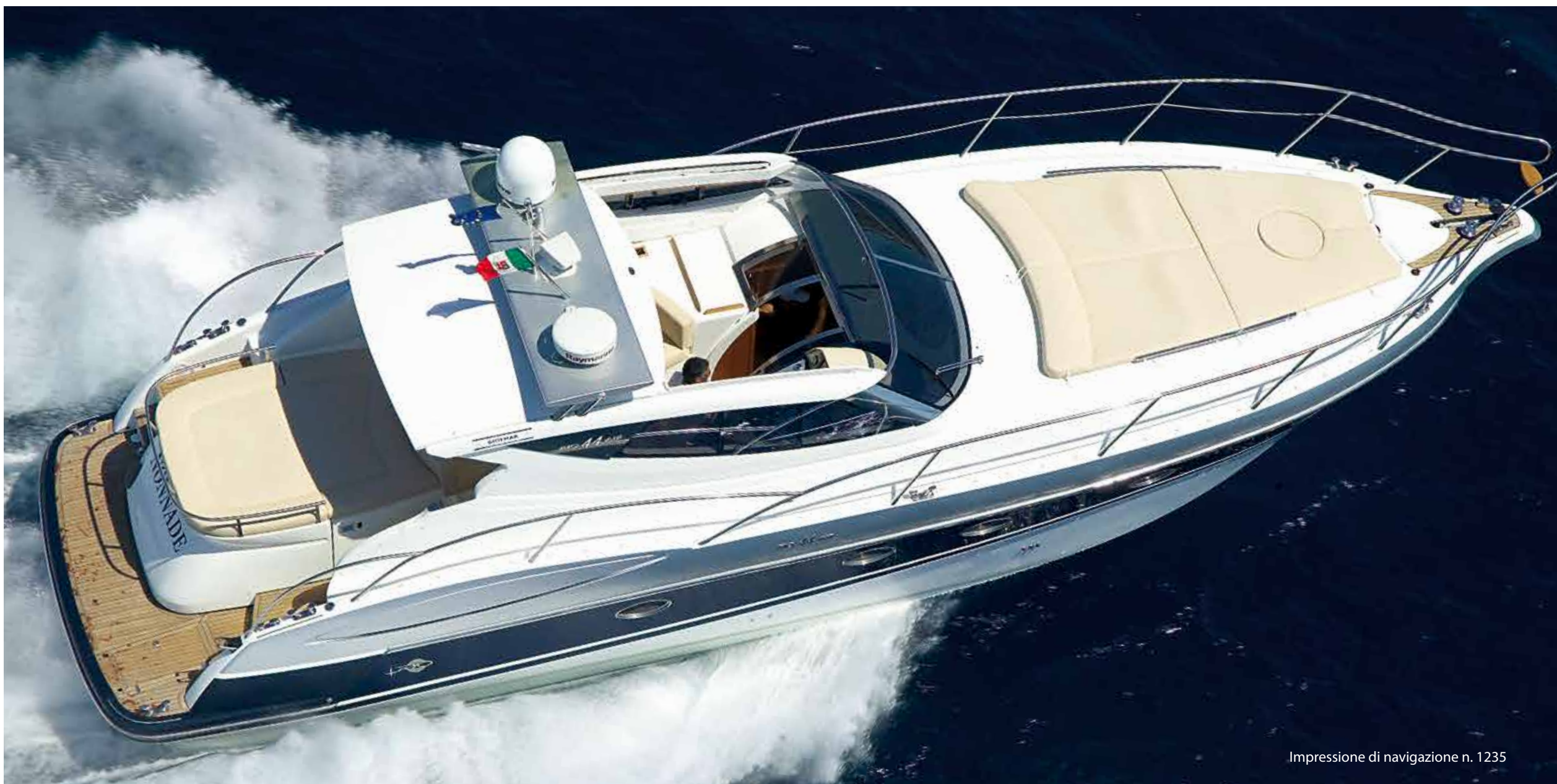
Impressione di navigazione n. 1235